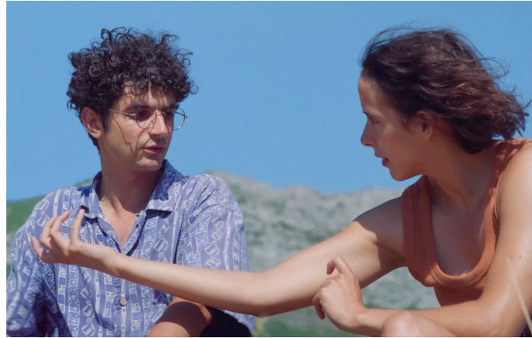
Les fleurs bleues