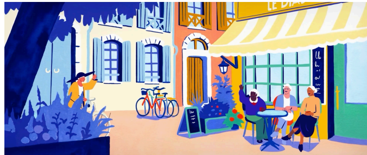
La bicyclette et le vélo