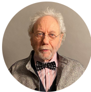
Jacky Berroyer En beauté