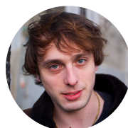
Andranic Manet Saint Honoré