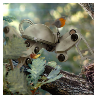
Ovo de Stiv Spasojevic